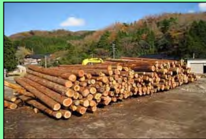
末口 \phi 16~22cm