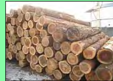
末口 \phi 20~36cm