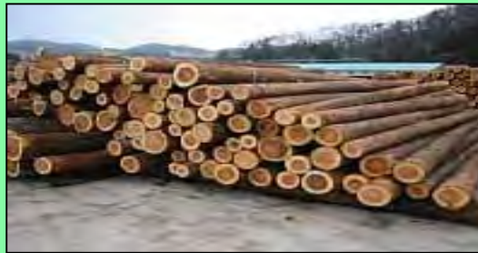
末口 約 \phi 20cm以上全て